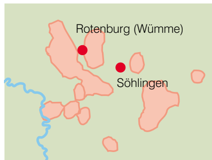
Erdgasfelder im Raum Rotenburg (Wümme)

ExxonMobil fördert Erdgas in diesem Bereich aus ca. 35 Bohrungen. Diese sind mit technisch anspruchsvollen Rohrsystemen ausgerüstet, um das Erdgas an die Erdoberfläche zu befördern. Den Bohrlochabschluss bildet das mit hydraulischen Absperrschiebern versehene Eruptionskreuz.