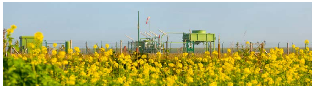
Erdgasbohrung Böttersen Z11

Zur Zeit wird ein umfassendes Grundwassermonitoring vor, während und nach der Maßnahme vorbereitet. Das Monitoringkonzept wurde 2013 gemeinsam mit den Bürgermeistern der umliegenden Gemeinden, mit Vertretern von Landkreis und Wasserversorgern sowie mit dem Vertreter einer Bürgerinitiative im Rahmen von vier „Runden Tischen“ abgestimmt. Die Grundwassermessstellen werden im Frühjahr 2014 errichtet. Hierzu wird ExxonMobil im Rahmen einer Informationsveranstaltung vor Ort im Detail informieren.