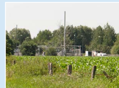
Erdgasbohrung Söhlingen Z10

Im Frühjahr 1995 wurde im Landkreis Rotenburg (Wümme) Geschichte geschrieben: Zum ersten Mal weltweit wurde in der Bohrung Söhlingen Z10 in einer Horizontalbohrung in fast 5.000 Metern Tiefe eine vierfache Frac-Maßnahme durchgeführt. Dieser Weltrekord zeigt bis heute Wirkung: Seit fast 20 Jahren wird aus dieser Bohrung erfolgreich Erdgas produziert – bis heute mehr als 1,3 Milliarden Kubikmeter.