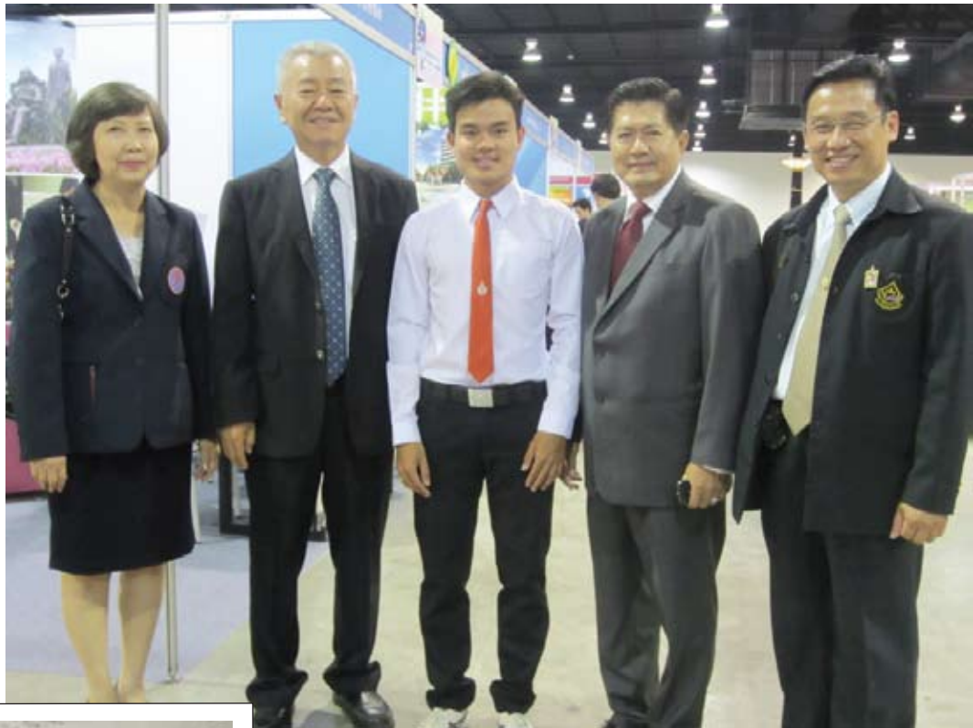
จดหมายจากนิสิตนักศึกษา ที่มาสัมผัสขอรับทุน เอสโซ่สมโภชกรุงรัตนโกสินทร์ ๒๐๐ ปี